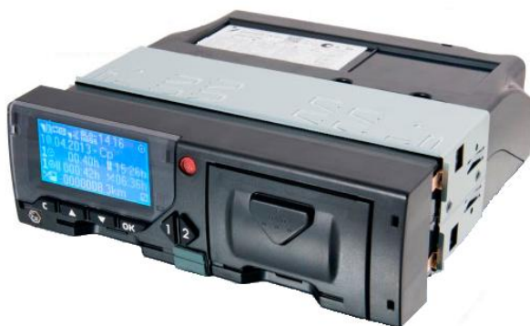
Рисунок 1 – Общий вид тахографа

Внешний вид тахографов приведен на рисунках 1-2.